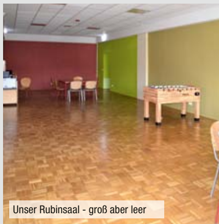
Unser Rubinsaal - groß aber leer

Mit Ihrer Spende könnten wir die so dringende Umgestaltung im kommenden Jahr durchführen und damit Kindern ein Lächeln schenken.