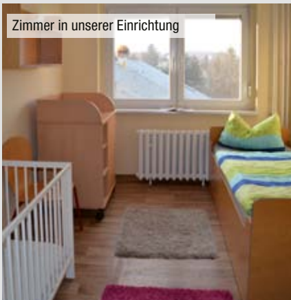
Zimmer in unserer Einrichtung

Der ehemalige „Rubinsaal“ des Hohburger Kulturhauses bietet viel Platz. Aber die finanziellen Mittel sind zu knapp, um aus dem großen leeren Saal diese Räume schaffen zu können.